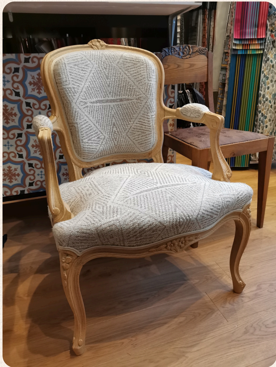
PAIRE CABRIOLET STYLE LOUIS XV RÉFECTION COMPLÈTE EN CRIN. FINITION DOUBLE PASSEPOIL.