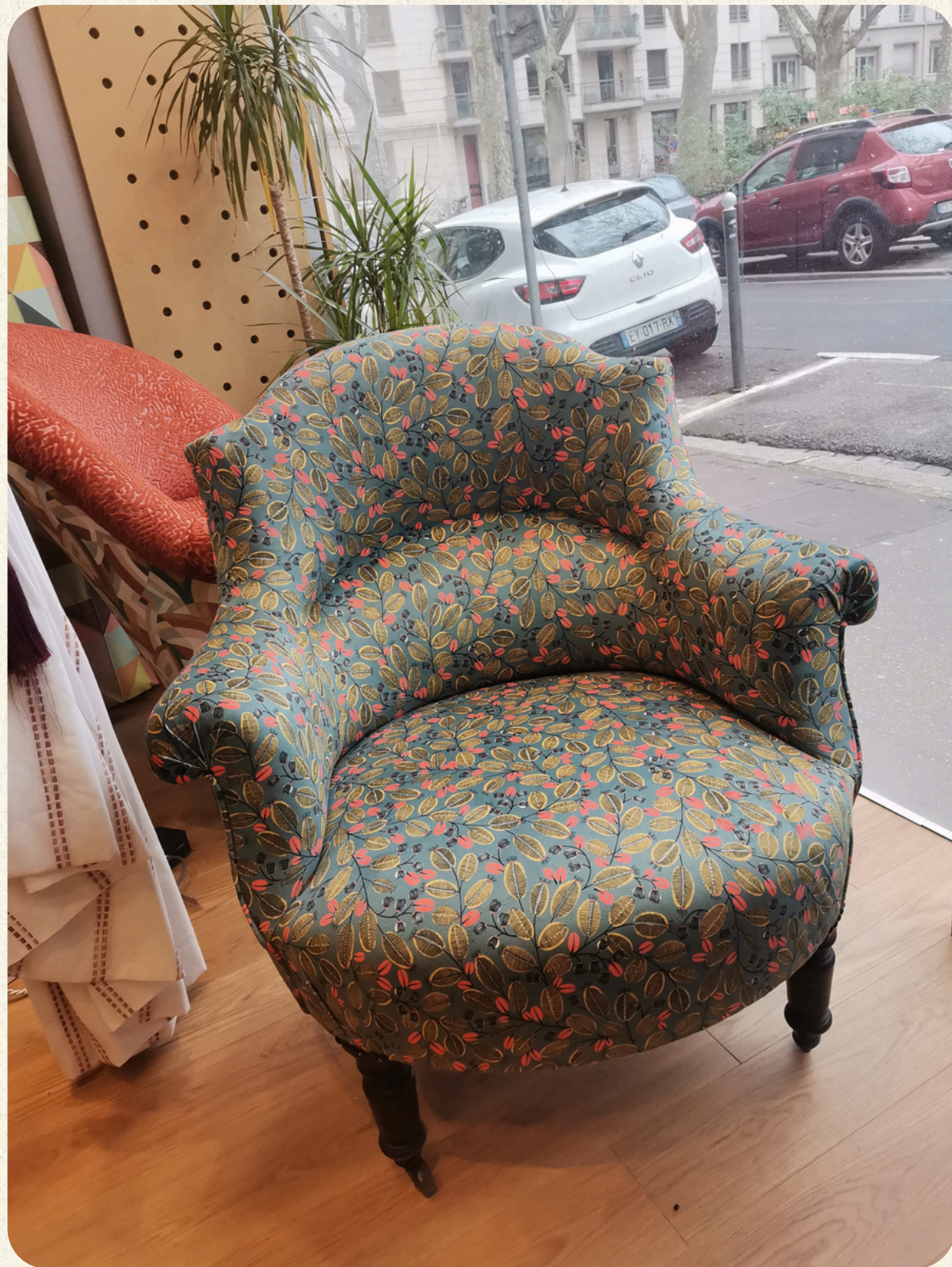
FAUTEUIL CRAPAUD RÉFECTION COMPLÈTE ASSISE EN MOUSSE RÉFECTION PARTIELLE DOSSIER