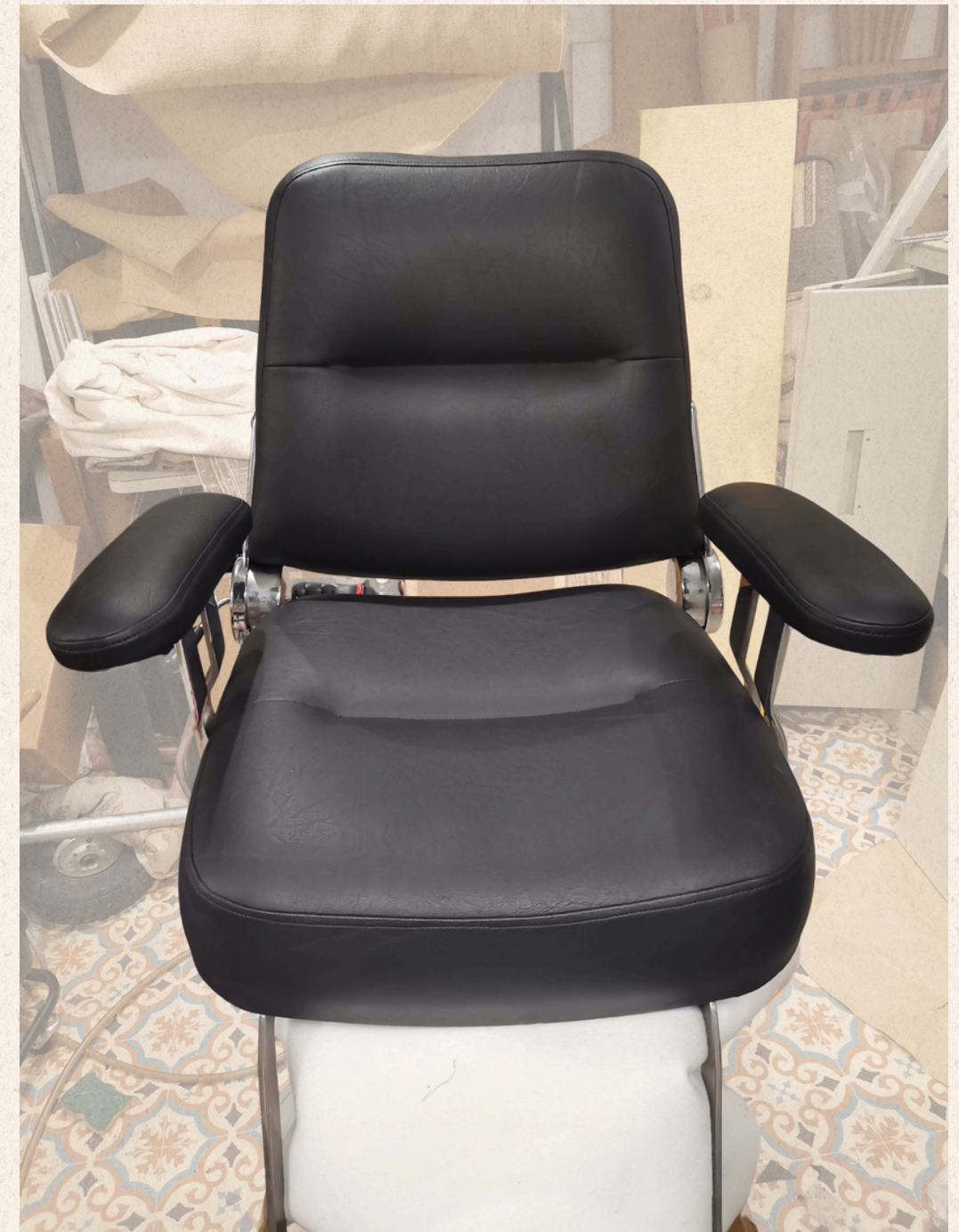
SIÈGE DE COIFFEUR RÉFECTION DE L'ASSISE EN MOUSSE. CHANGEMENT DE TOUTES LES HOUSSES EN SIMILI.