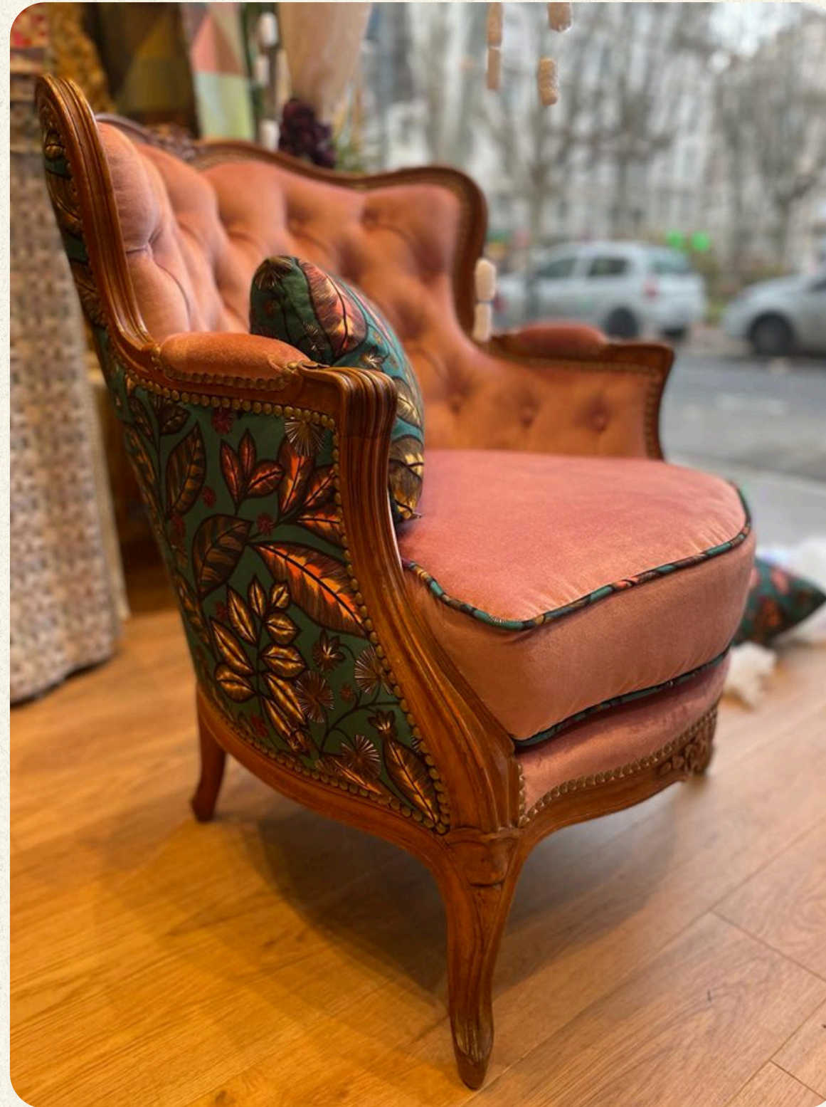
BERGÈRE LOUIS XV DOSSIER CAPITONNÉ EN CRIN. FINITION CLOUTÉ.