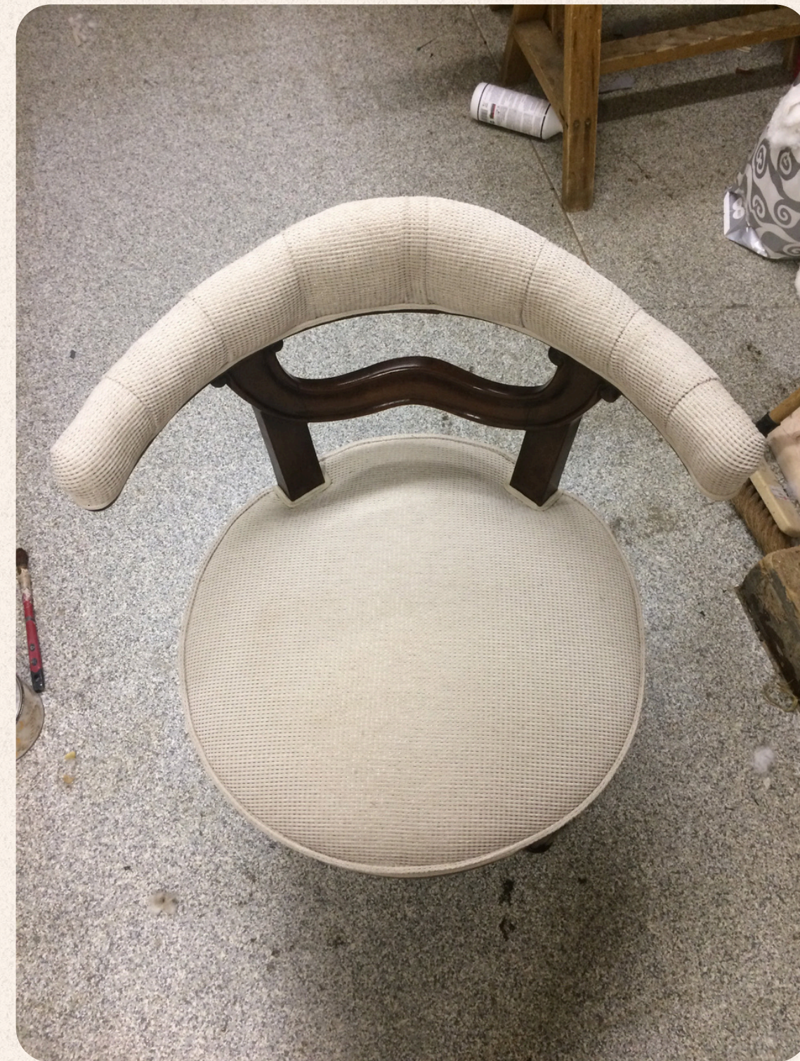
CHAISE STYLE LOUIS-PHILIPPE RÉFECTION PARTIELLE HOUSSE D'ASSISE AVEC PLATEBANDE ET INSERTION D'UN PASSEPOIL.