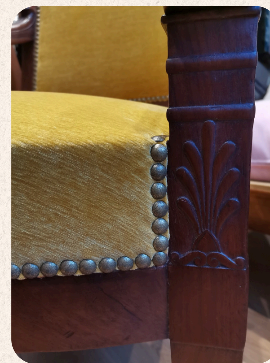
FAUTEUIL EMPIRE RÉFECTION COMPLÈTE EN CRIN