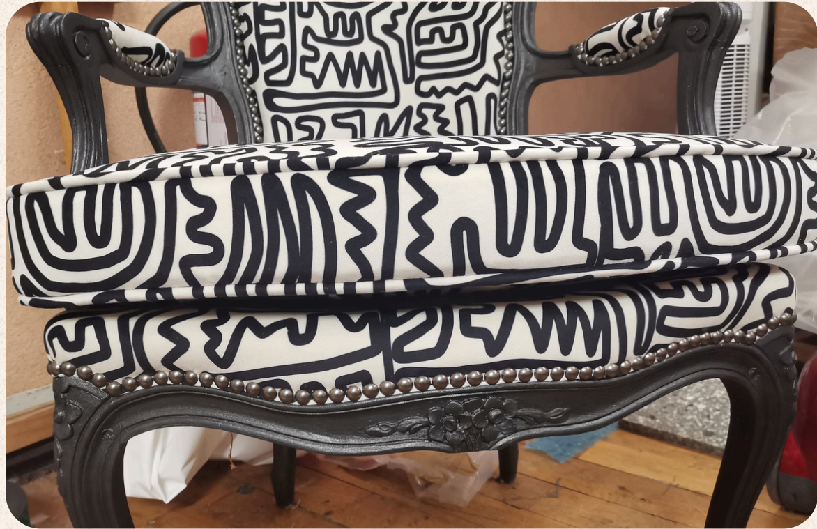
CABRIOLET LOUIS XV RÉFECTION COMPLÈTE EN MOUSSE FINITION CLOUTÉE COUTURE HOUSSE COUSSIN PASSEPOILÉ