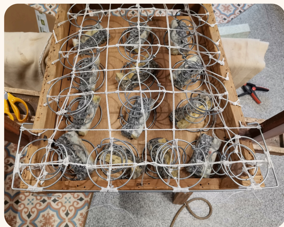
FAUTEUIL ART DÉCO RÉFECTION COMPLÈTE DE L'ASSISE EN CRIN AVEC GUINDAGE SUSPENDU. RÉFECTION PARTIELLE DU DOSSIER. FINITION PASSEPOIL ET GALON PLAT.