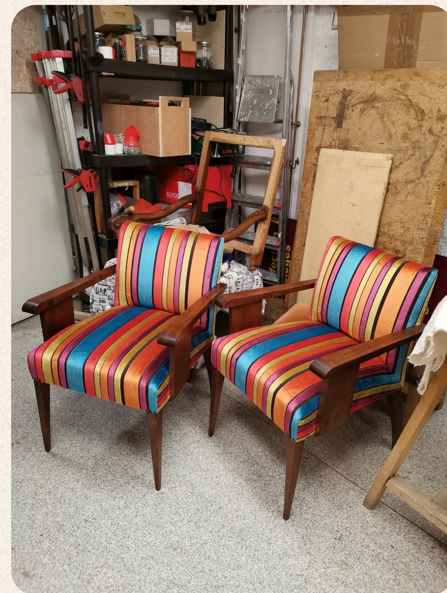
FAUTEUIL ART DÉCO RÉFECTION COMPLÈTE EN MOUSSE.