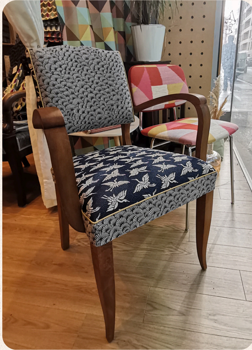
FAUTEUIL BRIDGE RÉFECTION COMPLÈTE EN MOUSSE FINITION PASSEPOIL